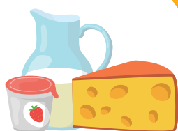
МОЛОКО, ЙОГУРТ И СЫР