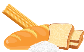
ХЛЕБ, ЗЛАКИ, МАКАРОНЫ И РИС