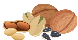
ОРЕХИ И СЕМЕНА