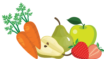
ФРУКТЫ И ОВОЩИ